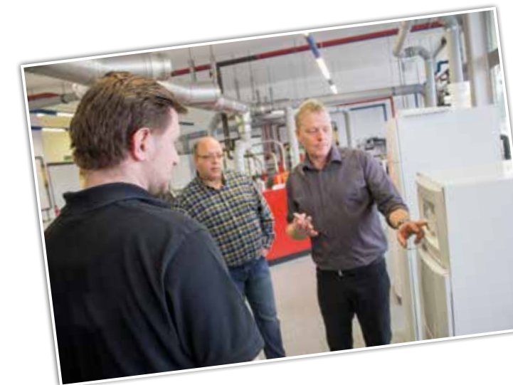
„Tolle Events, familiäre Atmosphäre, gute Freunde bei Remeha“